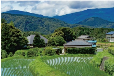
里地里山について