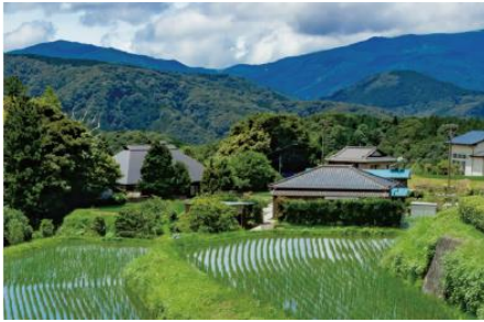
里地里山について